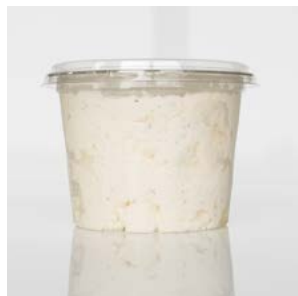
MEDLINE KAASCÈRE TRUFFEL