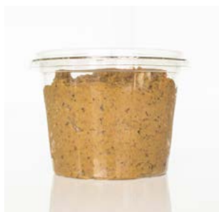
MEDLINE AUBERGINE KAVIAAR