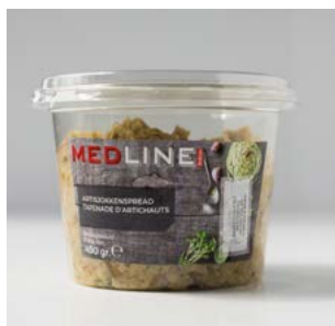
MEDLINE ARTISJOKKEN SPREAD