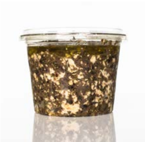
MEDLINE TRUFFEL TAPENADE