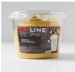
MEDLINE HUMMOUS TIKKA MASALA