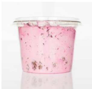
MEDLINE KAASCÈRE RODE BIET