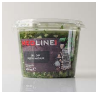
MEDLINE PESTO NATUUR