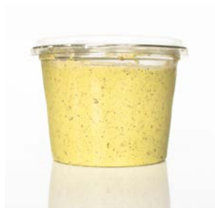
MEDLINE ERWTEN MUNT HUMMOUS