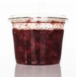
MEDLINE VEENBESSEN - WITLOOF