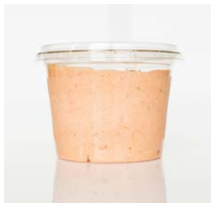
MEDLINE KAASCÈRE CALABRESE