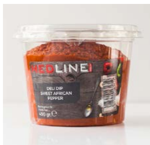
MEDLINE SWEET AFRICAN PEPPER