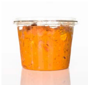
MEDLINE POMPOEN - GEITENKAAS