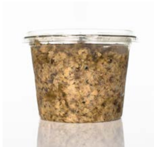
MEDLINE TRUFFEL - CHAMPIGNON