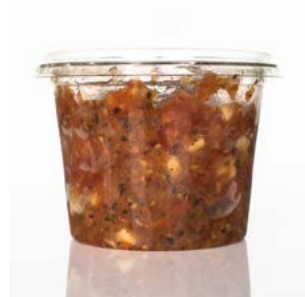
MEDLINE TOMATEN CHUTNEY