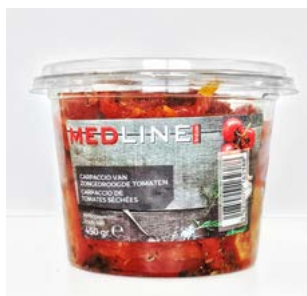
MEDLINE TOMATEN CARPACCIO