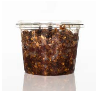
MEDLINE NOTEN TAPENADE