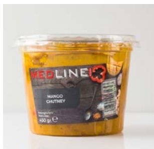
MEDLINE MANGO CHUTNEY