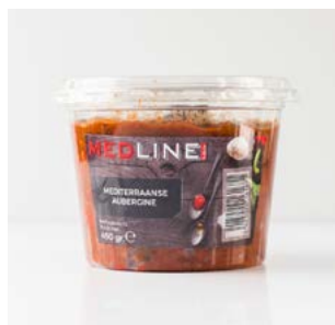
MEDLINE MED. AUBERGINE