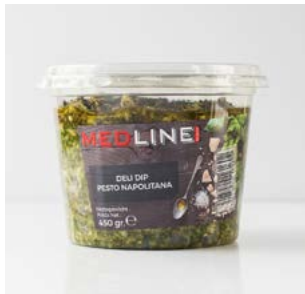
MEDLINE PESTO NAPOLITANA