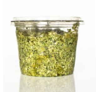
MEDLINE EDAMAME PESTO