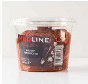
MEDLINE PESTO ROSSO