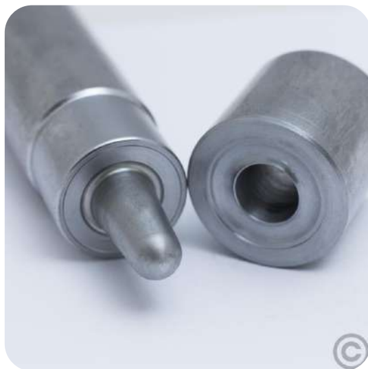
Eyelet Punch - Punzón para Ojales

000 GR HV 00 GR HV 0 GR HV 1 GR HV 2 GR HV 3 GR HV 4 GR HV 5 GR HV 6 GR HV 8 GR HV