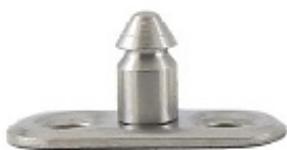
A4 904 R00