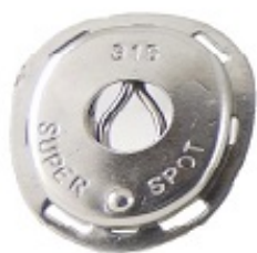
A4 900 T & W R00

Nuestros Super Spot A4-316 de acero inoxidable A4-316 son perfectamente adecuados para su uso en una amplia variedad de sectores, incluidos el marítimo, el automotriz, el militar, el textil y el ocio al aire libre. Al igual que todos nuestros productos, estos Super Spot cumplen con los más altos estándares de rendimiento y confiabilidad.