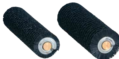
Diametri disponibili Available diameters

Rullo composto da una miscela di nylon + setole, montata su un nucleo a spirale. Ottimo l'utilizzo per i tessuti sottili e per le fibre unidirezionali. Lavora bene anche sulle superfici irregolari. Basso il rischio di tagliare la fibra. Prestare attenzione in quanto la forma a spirale e le setole potrebbero sollevare la fibra arrotolandola sul rullino. È piuttosto difficile da pulire.