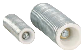
Diametri disponibili Available diameters