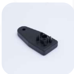
900 HP M