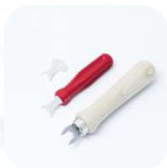
Verktyg för Tenax