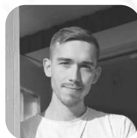
Marcus Tyborn Logistik & sälj

Besök oss på www.ossian.se samt följ oss gärna på Instagram: ossianlagerqvistab