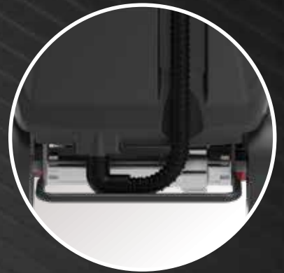
Reinforced roll bar

Presa USB per la ricarica del cellulare (Optional)