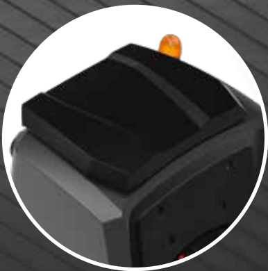
Large and easily inspectable tank

Serbatoio ampio facilmente ispezionabile