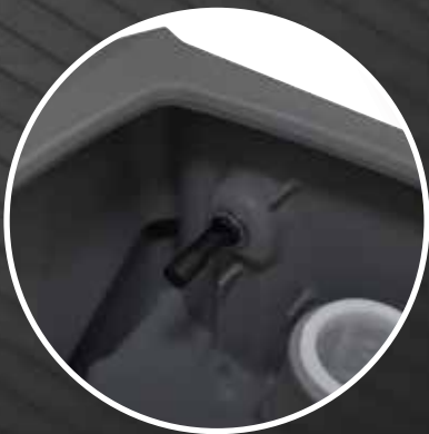
Electromechanical sensor for dirty water level signaling

Serbatoio ampio facilmente ispezionabile