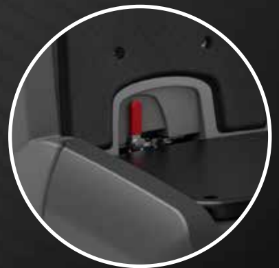
Tilting tank operated by lever

Sensore elettromeccanico per segnalazione livello acqua sporca