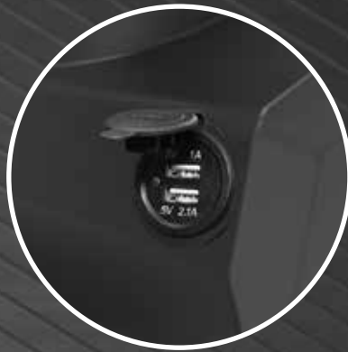
USB socket for charging of the cell phone (Optional)

Sistema di riempimento a galleggiante con aquastop (Optional)